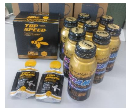
今回の参加賞はコチラ!!