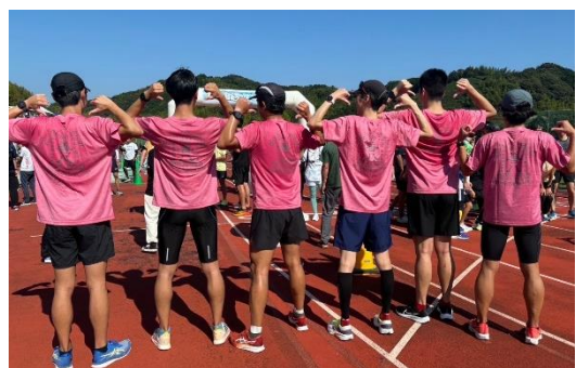
お揃いのやいづ善八Tシャツを着て走りました!

10/13(土)に「4時間耐久リレーマラソンin藤枝」が藤枝総合運動公園で開催されました。これは1チーム最大10名が1周1.8kmのコースを交代で走り、時間内に何週走れるかを競う大会で、今年には当社社員6名が有志チーム「Ring 8」として参加しました。リレーマラソンは、参加メンバー同士のコミュニケーションの活性化や健康増進、健康意識の向上にも繋がるため、健康経営の取り組みの一つとして、次回は会社として参加を企画したいと考えています。仲間と走ることを楽しんだり、新しい挑戦を応援したりするイベントのため、多くの社員や社員家族に参加いただけるような企画にできたらと思います。その取っ掛けとして、今回はサステナビリティ推進室より協賛という形でスポーツサプリメントを提供させていただきました。